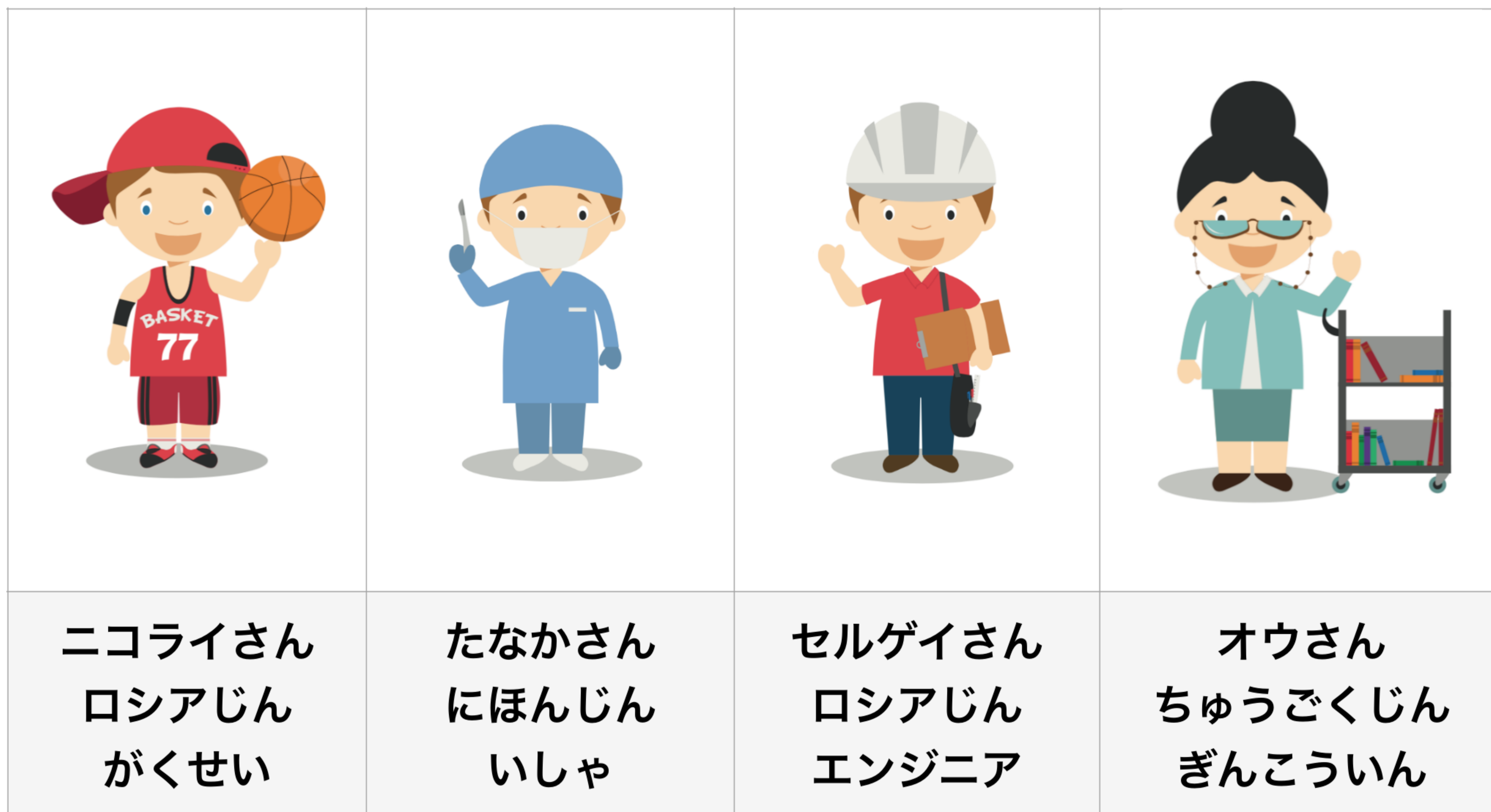
Таблица для выполнения заданий 3 и 4